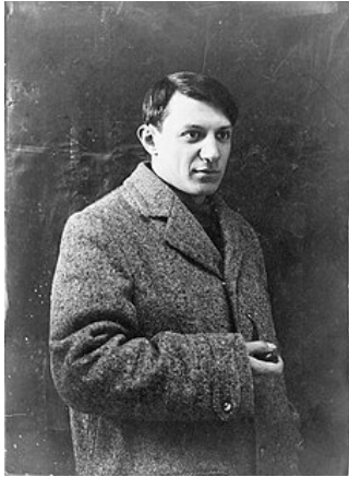
Picasso en 1908

« Quelqu'un que certains suivaient certainement était quelqu'un qui était complètement charmant. Quelqu'un que certains suivaient certainement était quelqu'un qui était charmant. Quelqu'un que certains suivaient était quelqu'un qui était complètement charmant. Quelqu'un que certains suivaient était quelqu'un qui certainement était complètement charmant.