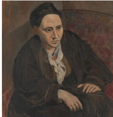
Portrait de Gertrude Stein- Picasso 1906

Conception, mise en scène, chorégraphie :